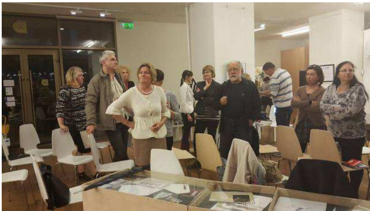
2. A VIMM tagok újra zsűrizik az Vizuális kultúra Országos Középiskolai Tanulmányi Verseny munkáit. Helyszín: Kaptár Archivum.